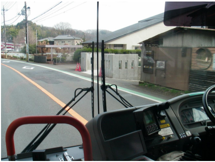
すみよしの森クリニック付近 グリーンベルトがある