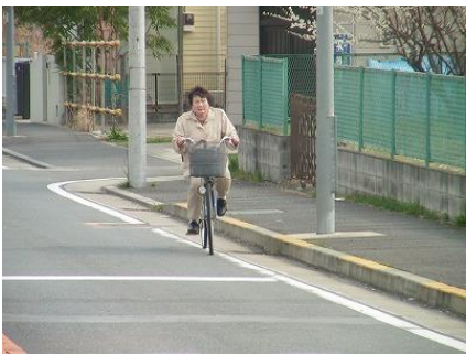
上麻生線 歩道は波打っている