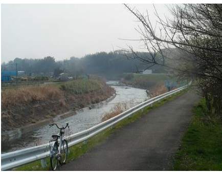
環状 4 号を青葉台駅に向かう