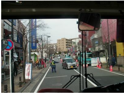
この道は両側とも混んでいる