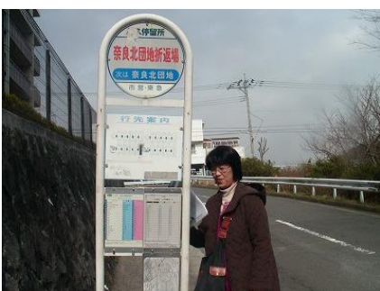
奈良地区センター前 誰が置いたの 椅子・・・