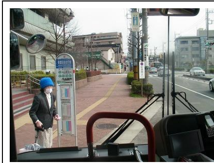
青葉区役所前 改善されたバス亭