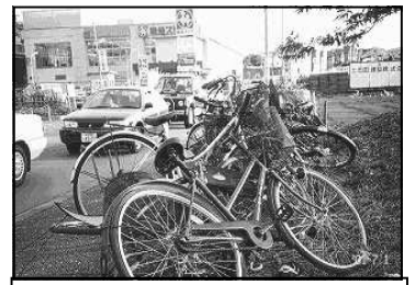
田奈駅周辺の放置自転車